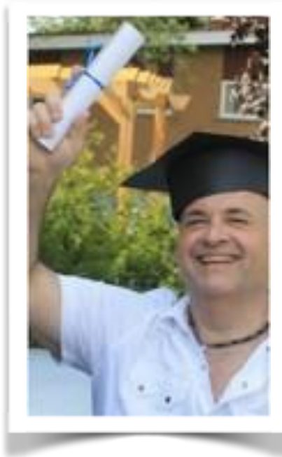
Conférence sur le bénévolat à l'école primaire De Monnoir